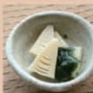
あかめといっしょに