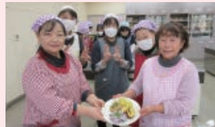
おせち料理づくり