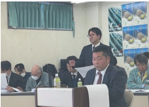
実績報告等を行いました

異常気象等の影響を受けながらも品質を落とすことなく、出荷が終了となりました。今後も出荷量の確保、安定的な出荷と生産力の強化に取り組む事を確認しました。