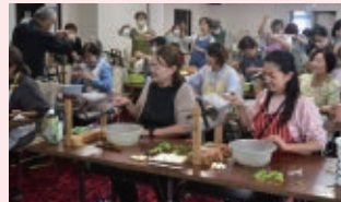
ランプシェードづくり