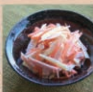
マヨネーズと和えてサラダに