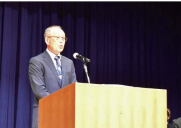
中古部会長の挨拶

同部会は、生産力強化を重点課題とし圃場巡回や講習会の充実で出荷量の維持と拡大に取り組みます。