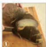
① 根元を切り落とし、先端部分を斜めに切る。