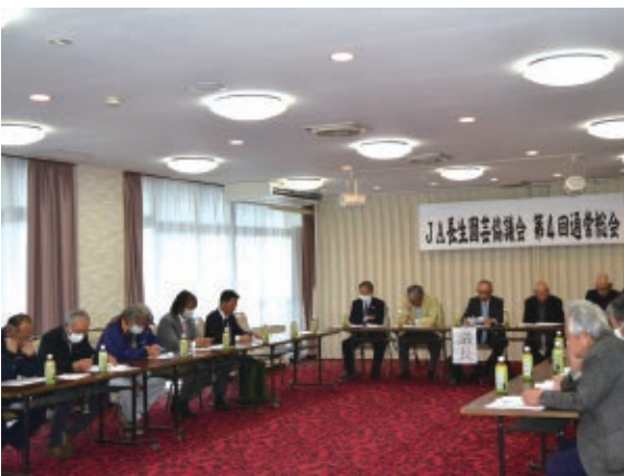
全ての議案について決議されました

次年度も「ながいき」ブランド力と組織力の強化、「青果物の安全安心な生産・出荷」に向けた講習会の開催等に取り組むことを申し合わせました。