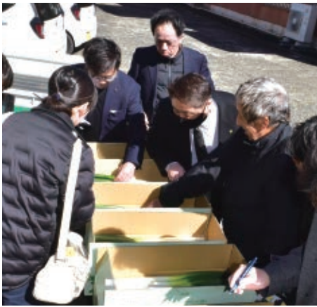
審査を行う審査員

審査員は「出品されたどのねぎも素晴らしいものであった。生産者の努力が感じられる」と講評しました。