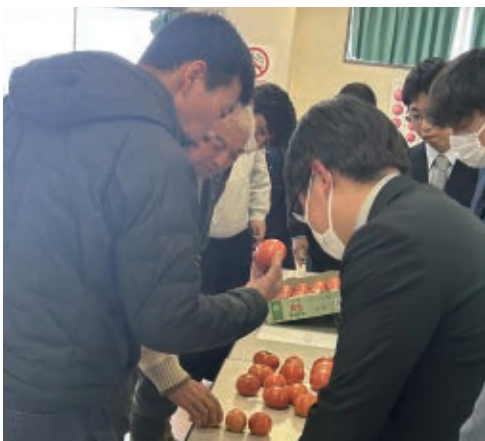
市場関係者と出荷規格を確認