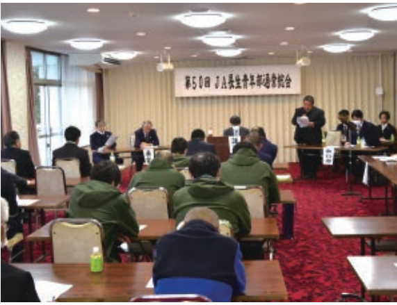
議事進行のようす

今後も活気ある組織づくりに取り組むとともに、部員や地域農業の発展につながる組織としての在り方や方向性の検討など営農と生活、緑を守る運動を実践してまいります。