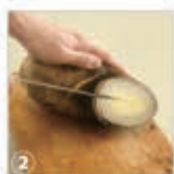
② 縦に1本 (深さ1~2cm程度) 切り込みを入れる。