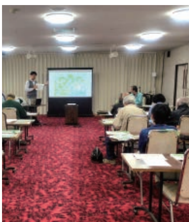
講義を聞く生産者