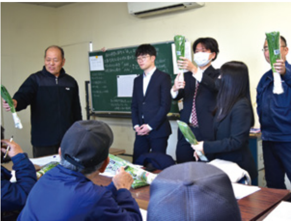
生産者とともに現品を確認する市場関係者

同部会は、市場をはじめ各関係機関と連携し情報共有の強化により、有利販売に取り組みます。本年は令和7年3月までに1万6,000ケース(1ケース1キロ)の出荷を計画しています。