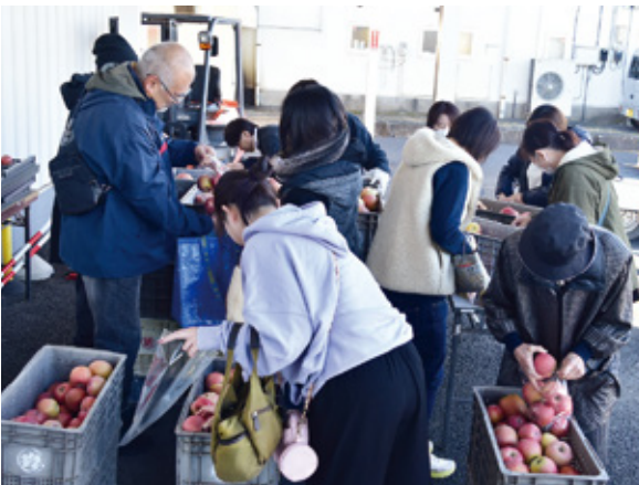
りんごの詰め放題大好評でした

ながいき市場では、本年も様々なイベントを企画しております。新鮮で安全・安心な農産物を取り揃えて皆さまのご来店を心よりお待ちしております！