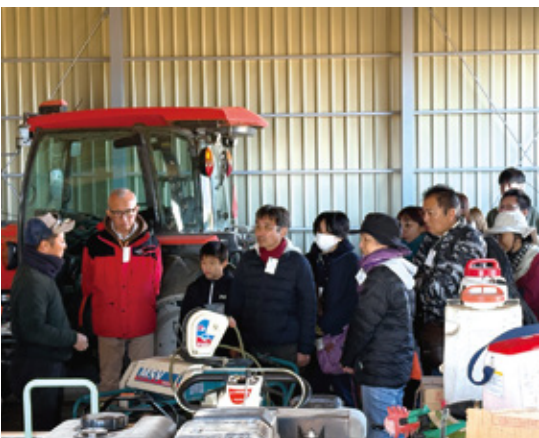
生産者と対話する参加者ら

参加者からは「どの農家さんも農業の知識や経験を話してくださり、とてもありがたい時間だった」「就農に関する関心がさらに高まった」と大変好評でした。