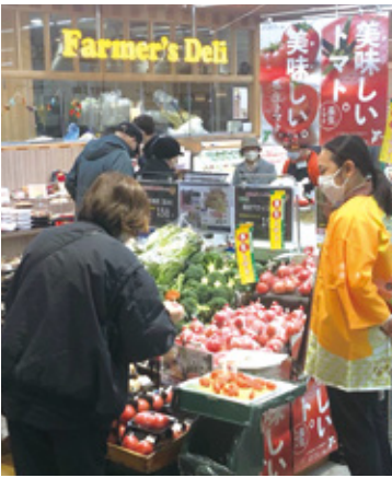
トマトの試食を行いました

試食をした来店者からは「みずみずしくて美味しい」との声が聞こえ、多くの方に購入していただきました。次回の販促活動は2月頃に実施予定です。