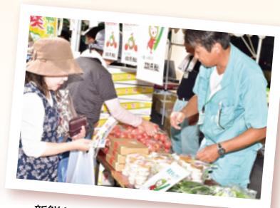
新鮮な野菜や果物はいかがですか