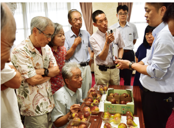
規格を確認する生産者

各組織は昨年まで、それぞれが独自の箱を使用して出荷していましたが、共計共販に向けた一歩として本年から箱を統一して出荷を始めます。