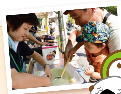
上手にすくえたかな？

「ながいき美人」は、JA長生産1等級銘柄の「コシヒカリ」です。粘りのある食感、甘みを含む食味が特徴で、お客様から定評があります。JAでは、「ながいき美人」のPRを通じて米の消費拡大と地産地消をすすめていきます。