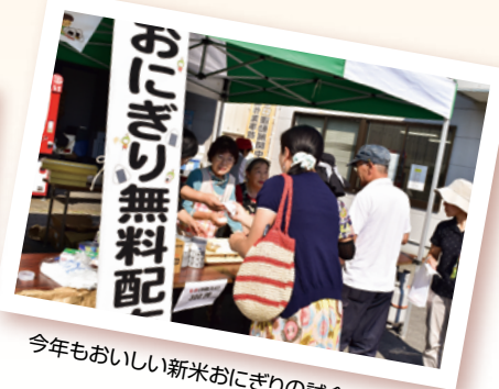
今年もおいしい新米おにぎりの試食