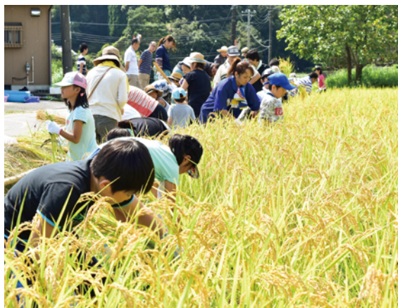
刈り取りに汗を流す親子

JA長生は、生産者と消費者の対面コミュニケーション効果を高め、地場農産物への愛着心や安心感を深めてもらうことを目的に、茂原市で稲刈り体験を開催し、家族連れなど約40人が参加しました。 市内で耕作放棄地の復元に取り組んでいる内海農園の指導のもと、参加者は鎌の使い方や稲の束ね方などを学びました。「コシヒカリ」を丁寧に刈り取り、束ねた稲は今では珍しい「おだかけ」をしました。 稲刈りの後はおにぎりやオードブルが振る舞われ、参加者にも笑顔がこぼれていました。