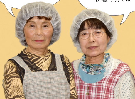
調理 (JA長生女性部長柄支部の方々)