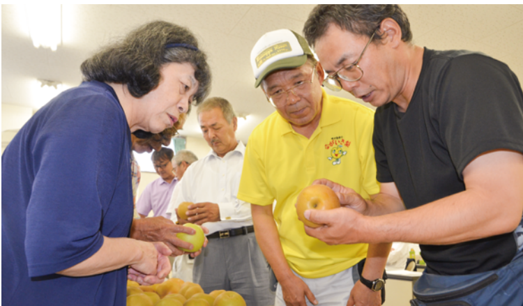
高品質ながいき梨の出荷を徹底

査定会では、生産者が持ち寄った現品を等級ごとに分け、果実の大きさ、糖度、色回り、肉質などを細かく確認しました。「人づくり、土づくり、木づくりで築く『ながいき梨』」をスローガンに、組合一丸となって有利販売を目指すことを申し合わせました。「豊水」は1万5,000ケース(1ケース10kg)、「二十世紀」は1,000ケース(1ケース5kg)を目標に、9月中旬まで出荷します。