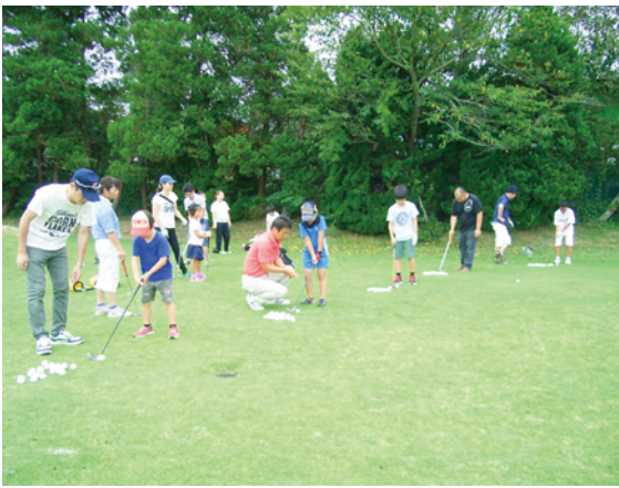
レッスンを受ける子供たち

普段親子で、一緒にプレーする機会の少ないゴルフ。1打1打に一喜一憂し、絆を深めることができました。