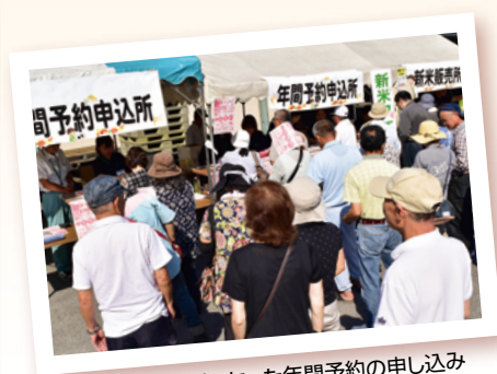
行列となった年間予約の申し込み