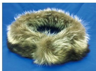
アライグマの毛皮のストール

(2) 家屋に侵入して繁殖します。仏壇が荒らされたり、屋根裏が糞尿で汚されたりします。