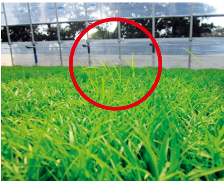
図1.ばか苗病症状(丸で囲った部分)

近年、発生が増えていて問題となっている病気に「ばか苗病」があります。主な症状として、