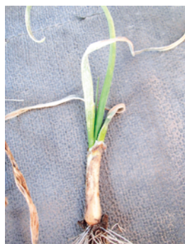
3月中旬に発生したべと病

発生初期には治療効果のある薬剤で防除し、多発した場合は発病株・部位を速やかに除去します。