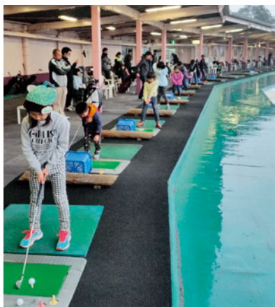
上手にできたかな？

普段親子で一緒にプレーする機会が無い中、家族のコミュニケーションが図れ、子供たちもプレーを楽しんでいました。