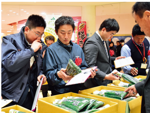
厳正な審査の様子

品評会終了後は来場者へ、葉玉ねぎの試食とプレゼントを配布し、旬のおいしさをPRしました。