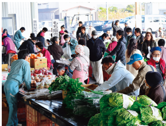
賑わった会場の様子

J A長生農産物直売所は12月3日、日頃の利用者、地域住民への感謝を込めて、お客様感謝フェアを開催し、野菜の特売などを実施しました。店頭には、長生トマトをはじめとした地元の新鮮野菜、卵や色とりど