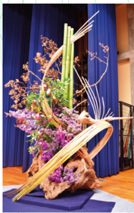
志穂美氏が制作した作品

という考え方から学ぶ地産地消の大切さ、添加物の危険性など、自分たちが何を食べきか、食材選びの重要性を改めて考えさせられる内容でした。また健康な体を維持するために大切なこととして、参加者全員で体操をしました。参加者からは「食生活を見直したい」「食材は成