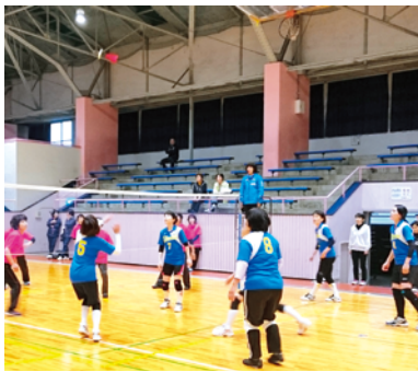
試合の様子(手前青のユニフォームが長生)

JA長生女性部は11月15日、千葉公園体育館で開催されたJA女性部フレッシュミズ交流集会のインディアカ大会に出場しました。県内10チームが参加し、熱戦が繰り広げられ、JA長生女性部は1セットも奪われることなく優勝しました。