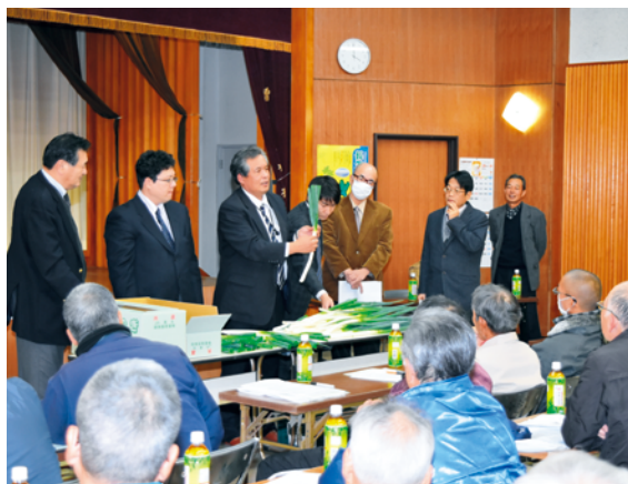
注意点を説明する関係者たち

査定会は、販売方針や出荷計画の確認、現品査定などを行いました。現品査定の際は、市場関係者などから生産者へ、葉枚数、根切り、太さなど、規格や調整の注意点について説明がありました。