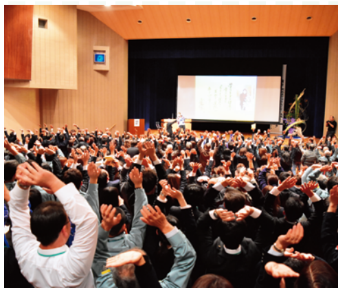
志穂美氏と参加者全員で体操