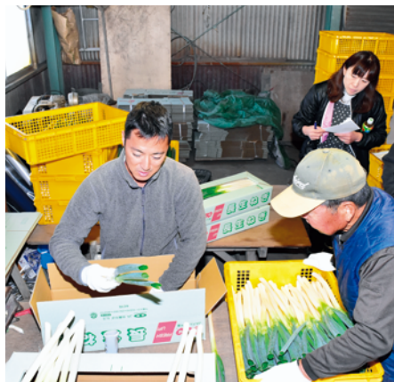
箱詰めを実践する生産者

今回はJ A管内のベテラン農家を講師に、出荷調整から箱詰めまでを実践し学びました。参加者は、管理機で土を削ってネギを掘り取り、根と