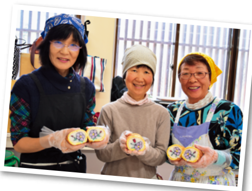
きれいな椿が完成

しい」と三拍子揃っています。子供の頃に母が作ってくれた太巻き寿司ですが、作る機会もなく自分では作ることが出来ませんでした。それが出来たことに感激で、作ったお寿司は、家族にも好評で楽しい食卓になりました。講座に