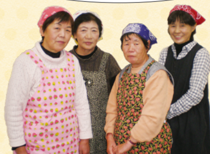
調理 (JA長生女性部睦沢支部の方々)

生ハムなますは簡単に作れ、うえ、彩りよくおしゃべり おもてなし料理にぴったりです。 大根とこねぎのつくねはヘルシーなハンバーグのようで、シャキシャキとした 食感がおいしかったです。