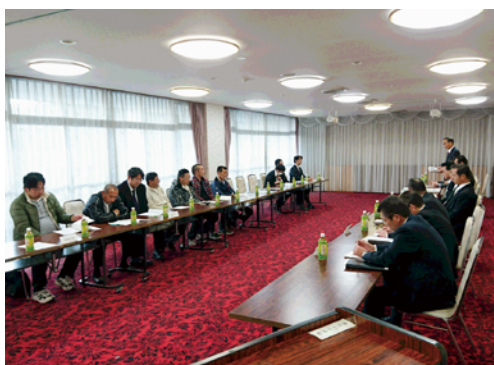
青年部対話交流の様子

青年部員から役員へ、J A 職員の人事異動について、支所など各事業所の施設修繕について、エコ米の取り扱いについて、肥料・農薬・資材の販売や情報提供についてなど、様々な意見、質問があり、活発な意見交換が行われました。