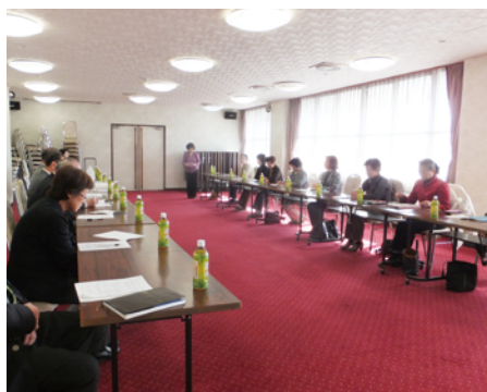
女性部対話交流会の様子