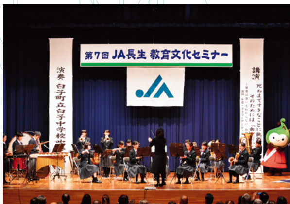
白子中学校吹奏楽部の心温まる演奏

JAは、次年度以降も充実したセミナーを開催するなど、地域にとって必要な存在であり続けるための活動を続け、地域に根ざした協同組合としてのJAを目指します。