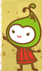
JA長生 ながいきなちゃん

参考：農林水産省「おせち料理ってどんな料理？」 http://www.maff.go.jp/j/agri_school/a_menu/oseti/01.html 「食品ロス削減に向けて」 http://www.maff.go.jp/j/shokusan/recycle/syoku_loss/