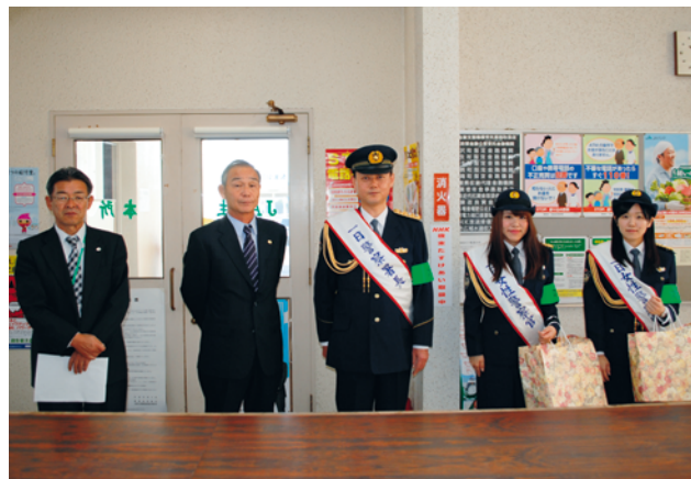
本所巡回時の様子

JA長生では本所、各支所に振り込め詐欺防犯指導員を設置しています。事件・事故の未然防止に取り組みんでいますので、組合員の皆様も何