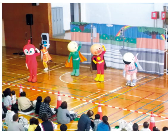
アンパンマンたちと交通ルールを学びました ©やなせ・F・T・N

り、体操をして交通安全のマナーやルールを学びました。ショーの後は、アンパンマンたちと握手会が行われ、参加した子どもたちはうれしそうに握手をしていました。