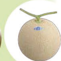
マスクメロン(6月~7月)