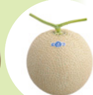
マスクメロン(6月~7月)