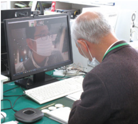
オンライン面談を行う職員

新型コロナウイルス感染症の感染状況を鑑み、会場に設置したパソコンを使ったオンラインでの出展とし、画面を通して支援センターで行える具体