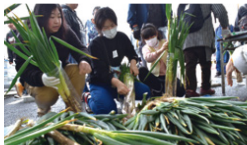
去年の泥ネギ詰め放題イベントの様子

鍋に入れたり、炒めたりとっても使いやすく美味しいネギの詰め放題にぜひチャレンジしてみてください。