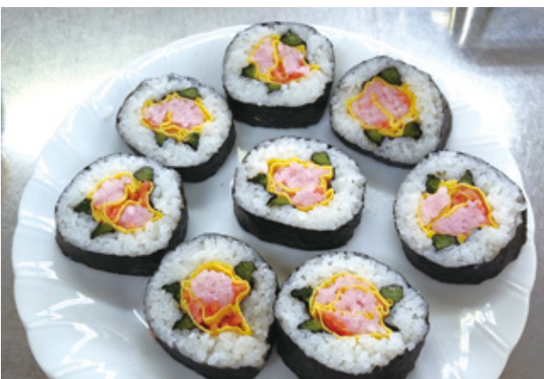
きれいなバラの模様ができました

作ったのは、海苔で巻いたバラの花と、卵焼きで巻いたさざんかの模様の2種類。出来上がりのバランスを考えながら、食材を並べ、すし飯の量に注意しながら丁寧な巻いていました。断面を見た参加者からは、歓声があがるほどの大成功でした。