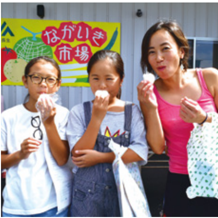
笑顔でおにぎりをほおぼる来場者

今回より新たに会場をながいき市場（茂原市六ツ野）に移し、新鮮な地元野菜の販売も多くの方に喜ばれました。