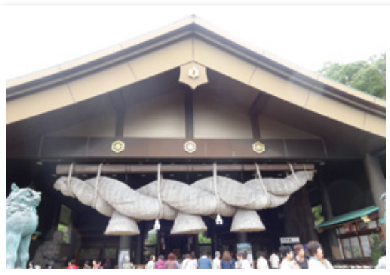
常陸国出雲大社にて参拝

今回の研修では、まずはじめに縁結びで有名な常陸国出雲大社の参拝を行いました。参加者は、見事な大しめ縄がかけられた拝殿に感動し、写真に収めていました。参拝後は、道の駅グランテラス筑西で昼食、お買い物タイム。今年7月にオープンしたばかりの北関東最大級の複合型