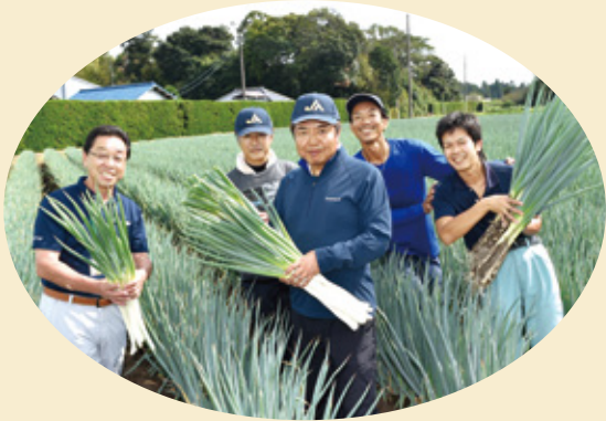
長生地域の農業を盛り上げていきます

ある仕事を求めて農業を志し、2年前から構想・準備をはじめ、来年度の就農に向けて、現在協議会の支援を受けています。