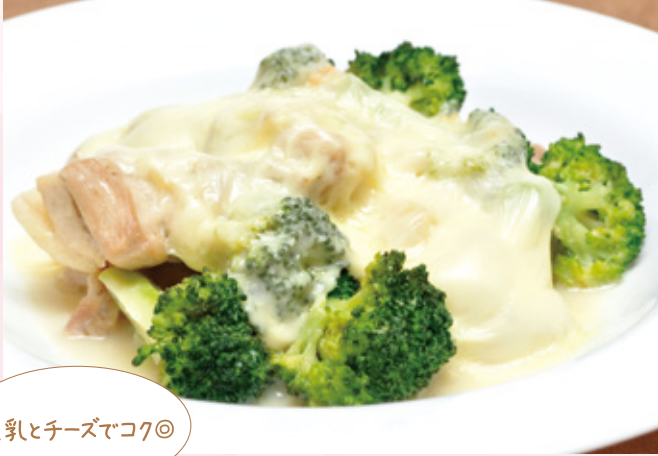
豆乳とチーズでコク◎